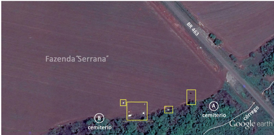
Figura 1 – Vista panorâmica do acampamento tekoha Apyka’i, em imagem de satélite de outubro de 2013.