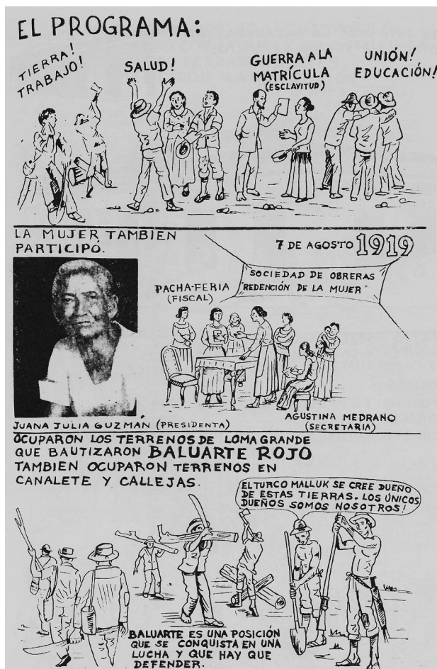
Figure 2: O conceito de “baluarte”, como articulada em Lomagrande, página 15.